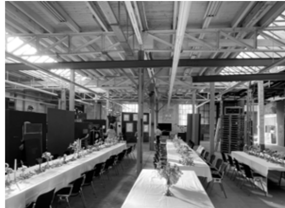
Grosse Halle (Fest-Inszenierung)