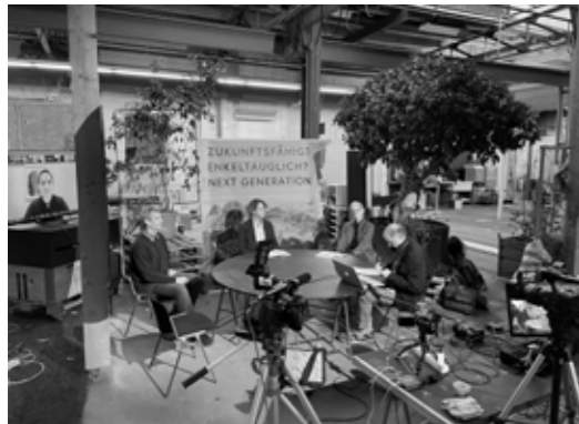
Dispo On Air (Filmstudio, Hybridevents)