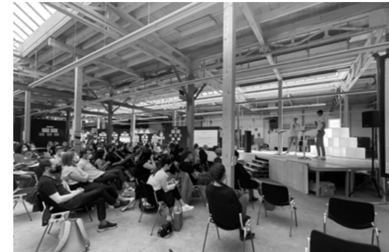
Grosse Halle (Event Campus Demokratie)