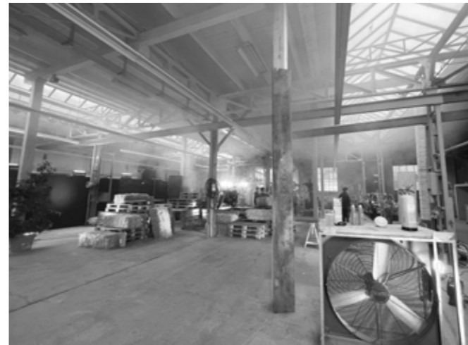
Grosse Halle (Platz bis 1-600 Personen, Filmset für GVB)