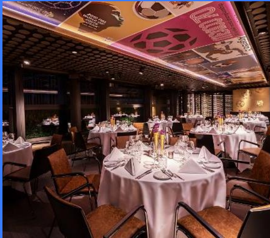
World Cup Lounge