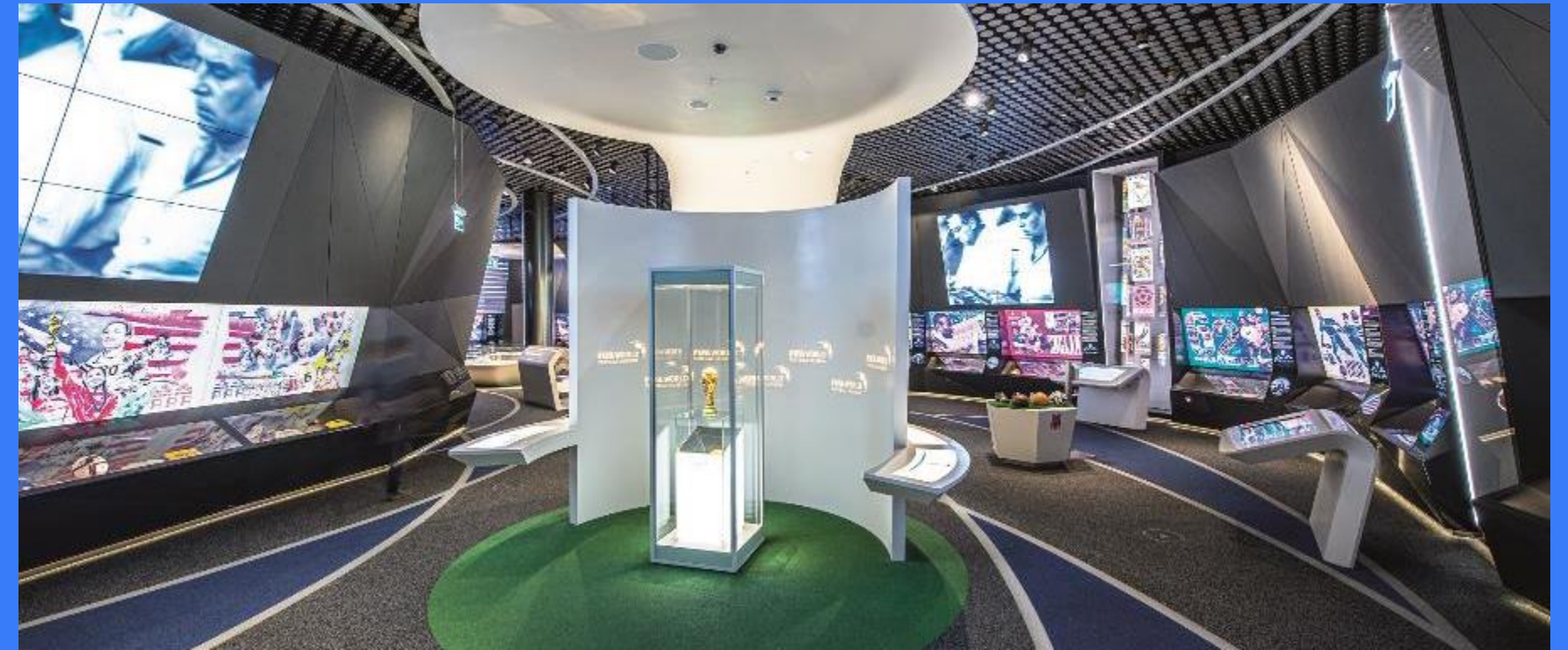
Rent a Museum