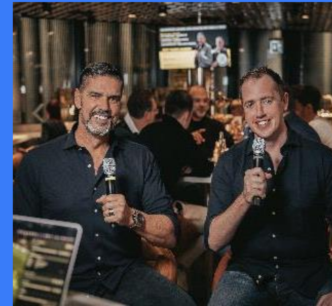
Fußball Live Analyse